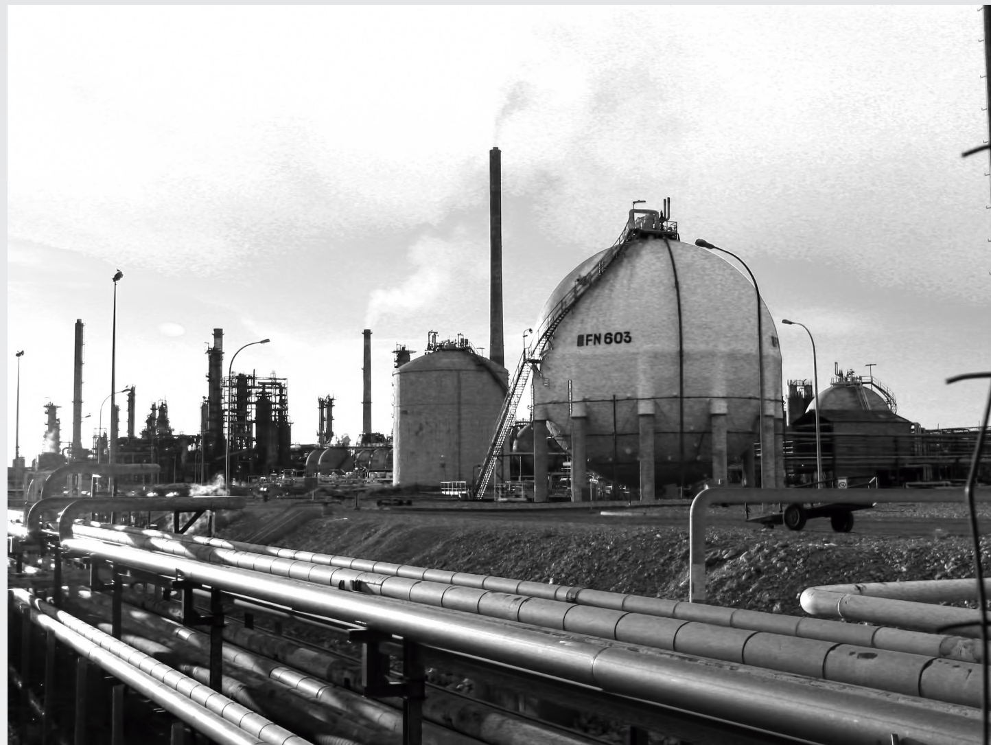
2. Courbes et lignes droites sur plusieurs kilomètres, les pipelines traversent ce paysage dévasté, où il ne subsiste plus aucune trace de nature et du vivant.

La raffinerie de Lavéra a été mise en service en 1933 avec une capacité annuelle de traitement de 350 000 tonnes de pétrole brut/an, l'effectif de la raffinerie et du dépôt étant alors de 450 personnes. Construite par la Société générale des huiles de pétrole, cette raffinerie a appartenu à la compagnie BP jusqu'en 2005, a été transférée à Innovene, filiale de BP, puis a été rachetée la même année par Ineos.