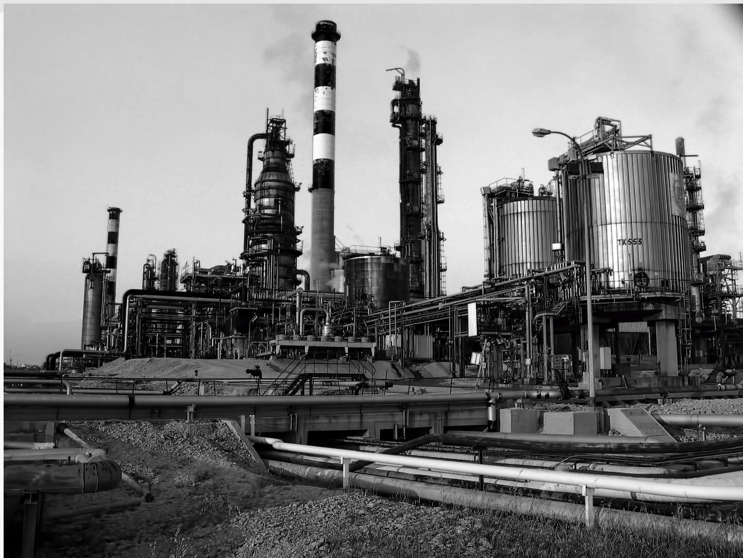
1. La raffinerie dressée face à la mer et au soleil couchant. Les différentes fumées émanant des cheminées et des tuyaux changent la teinte du ciel.