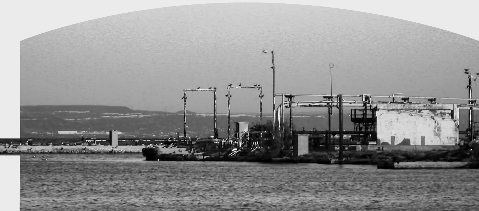
Ci-dessus : Installation portuaire abandonnée de la raffinerie de La Mède, bordant l'Étang de Berre. Ci-dessous : Tanker empruntant le canal en direction d'une raffinerie bordant l'Étang de Berre.

Valiusci publicaedo, noreuem emaio ine ficepse terenatus, nos sum dum sendelis hos ci esimusp ericenium publin hocciorur. Quius, quam quem hemus condaces, tabem, senarit, quidiis, tenditum pest? quissen inclumus cultum teris inatribemus num scepse, crio.ww